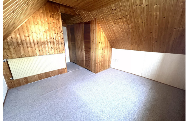
Zimmer 2 OG