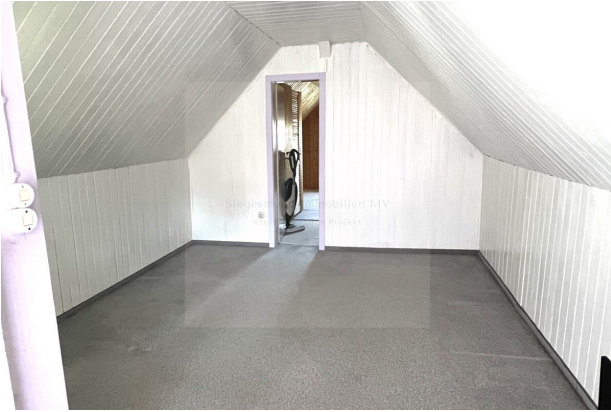
Zimmer 1 OG