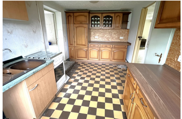
Küche Gewerbeobjekt (2)