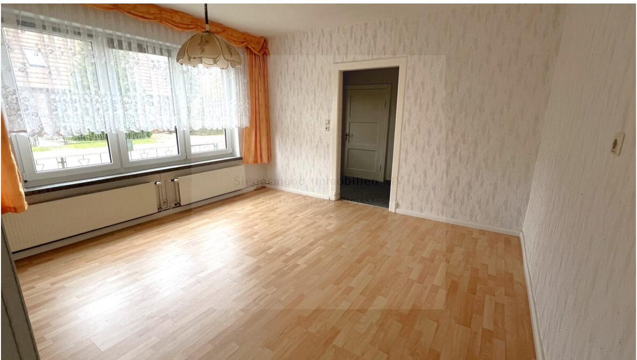
Zimmer 1 (2)

Siegesmund Immobilien MV • Zur Rieselwiese 7a • 19089 Demen Tel.: +49 38488 279887 • Mobil: +49 160 4166717 • Fax: +49 38488 279887 info@siegesmund-immobilien-mv.de • www.siegesmund-immobilien-mv.de