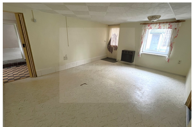
Raum 2 Gewerbeobjekt