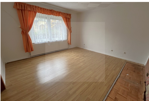
Zimmer 5 (2)